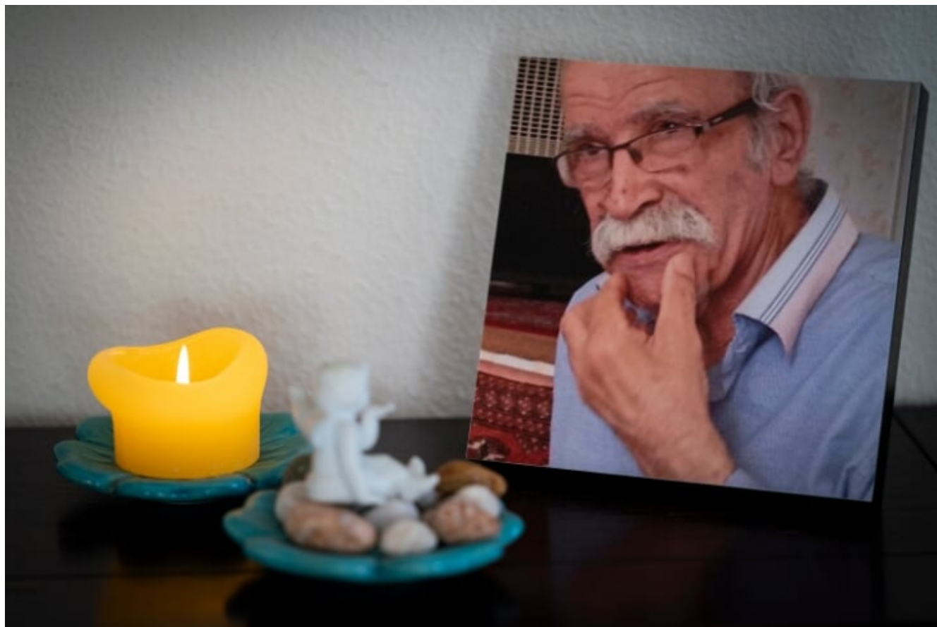
Een gedenkplekje voor haar vader, met stenen uit Iran

Hier in Nederland kwamen maar weinig vrienden langs om me te condoleren. Deels door de coronamaatregelen, deels door mijzelf. Want ik geloof nog steeds niet dat hij weg is. Ik zie hem nog staan achter het raam, hij vraagt me: ‘Als het lente is, kom je dan weer thuis?’