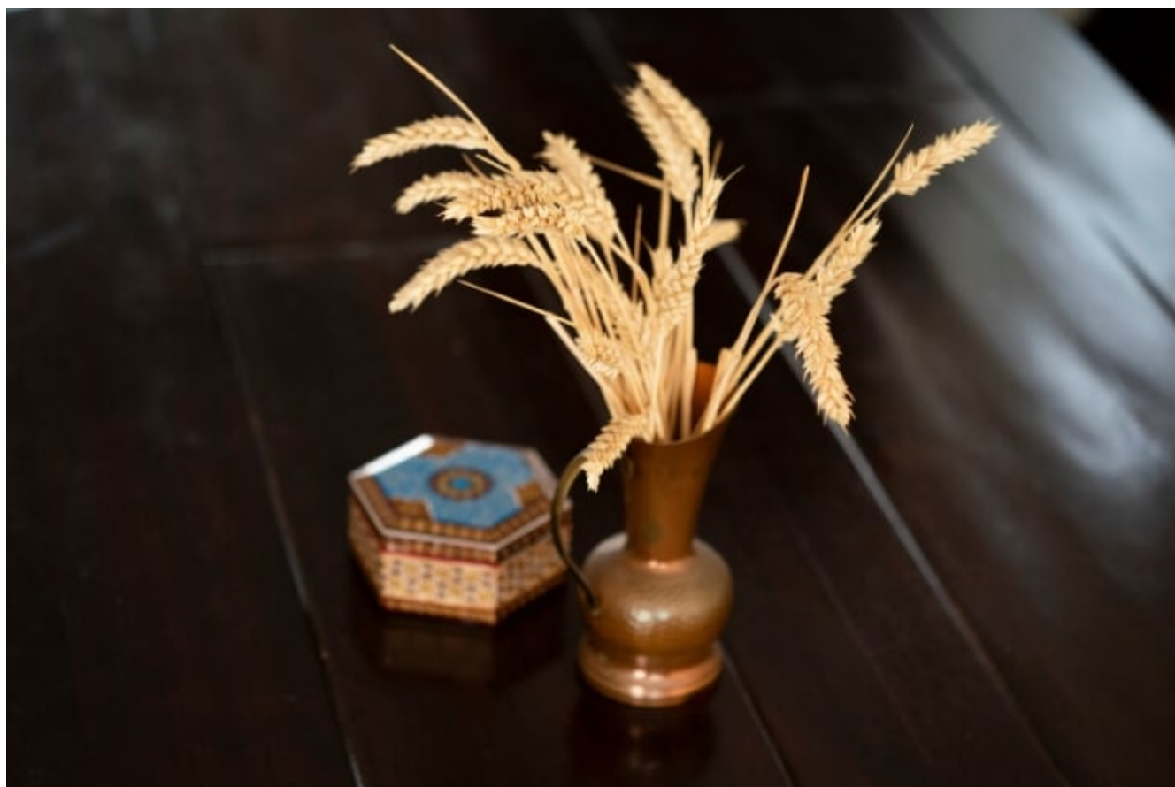
Het doosje en de korenaren op de tafel zijn symbolen voor thuis; een herinnering aan de warme gele akkers van Iran

Milena (45) verloor haar oom in Slovenië in de periode dat ernaartoe reizen door corona onmogelijk was. 'Hij was een belangrijk persoon voor mij. Twee jaar geleden zag ik hem voor het laatst. Het was heel emotioneel om daar te zijn. Hij was kampioen gewichtheffen en daarnaast ook schoonspringer, top-skiër en turner. Zo herinner ik hem ook: als een heel sterke, knappe man. Dat hij op het laatst zo was afgetakeld, vond ik heel erg. Net op het moment dat het hier met mijn vader heel slecht ging, kregen we vrij plotseling het bericht dat mijn oom was overleden. Ik zou ernaartoe zijn gegaan als dat gekund. Maar dat was geen optie, voor niemand. Hij kreeg een heel kleine uitvaart, en ze hadden daar geen livestream.